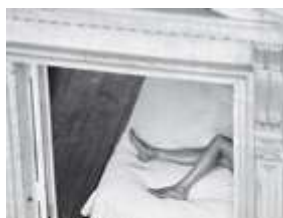
Antonio Soler Sur

Michel Houellebecq (1958) és poeta, assagista i novel·lista, “la primera estrella literària des de Sartre”. La seva primera novel·la, “Ampliació del camp de batalla”, va guanyar el Premi de Flore. Al maig de 1998 va rebre el Premi Nacional de les Lletres, atorgat pel Ministeri de Cultura francès. La seva segona novel·la, “Les partícules elementals”, va ser molt celebrada i polèmica, com també “Plataforma”. Houellebecq va obtenir el Premi Goncourt amb “El mapa i el territori” i va abordar el tema espinós de la islamització de la societat europea a “Submissió”.